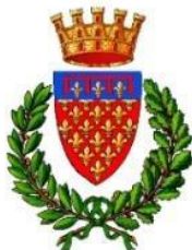
Comune di Prato